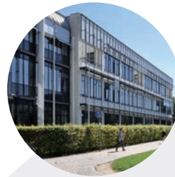
IHK CAMPUSzwo Augsburg